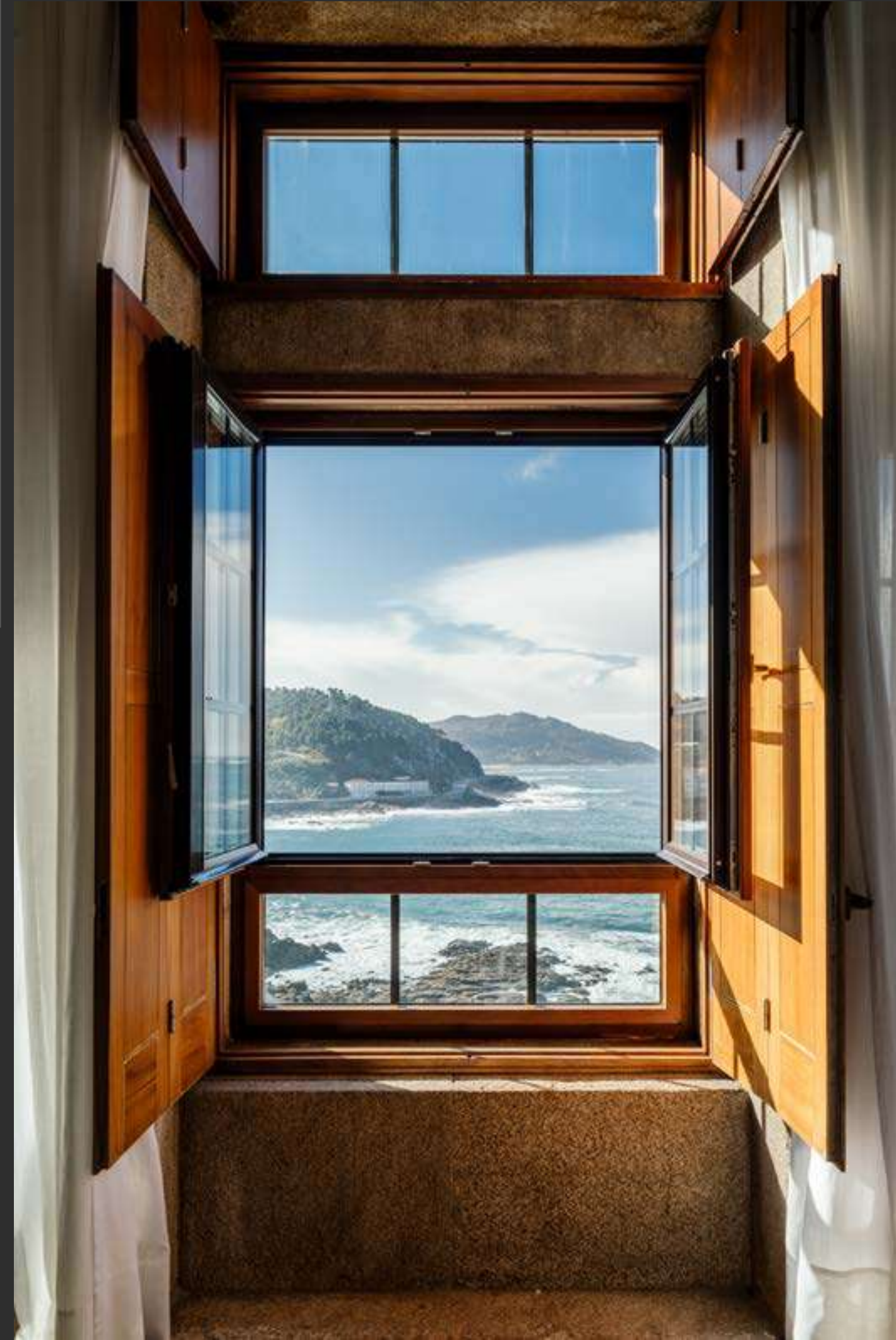
↑ Parador de Baiona. Parador of Baiona.