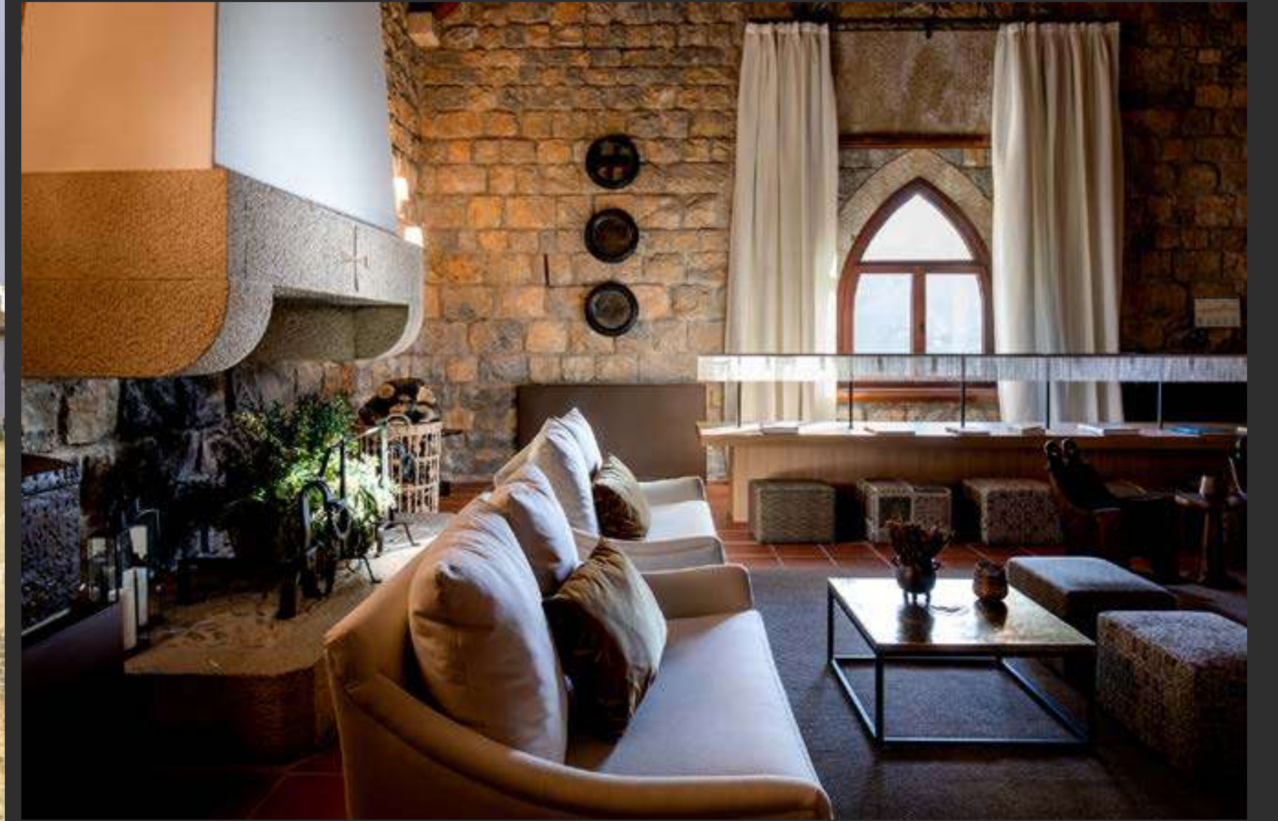
↗ Parador de Jaén Parador of Jaén