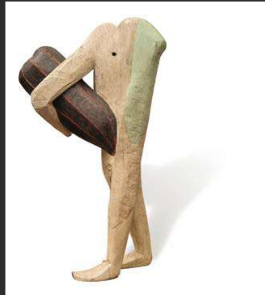
← FRANCISCO LEIRO Habero 1990. Madera de pino de Oregón policromada. Parador Costa da Morte

MANUEL HERNANDEZ MOMPÓ Characters on the street · 1974 Lithography. Parador of Málaga Gibralfaro