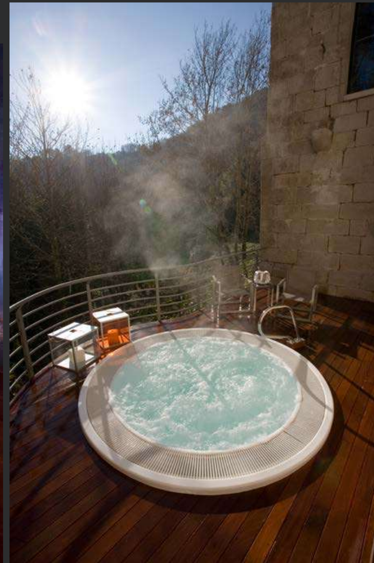
↑ Parador de Santo Estevo Parador of Santo Estevo

Haz una parada en el camino y revitaliza cuerpo y mente en nuestros Paradores con Spa. Relájate y libérate del estrés en nuestros centros especializados en relax y bienestar. Disponemos de una completa carta de tratamientos y rituales de belleza para todos los gustos. Toda una experiencia sensorial que tu cuerpo y mente se merecen.