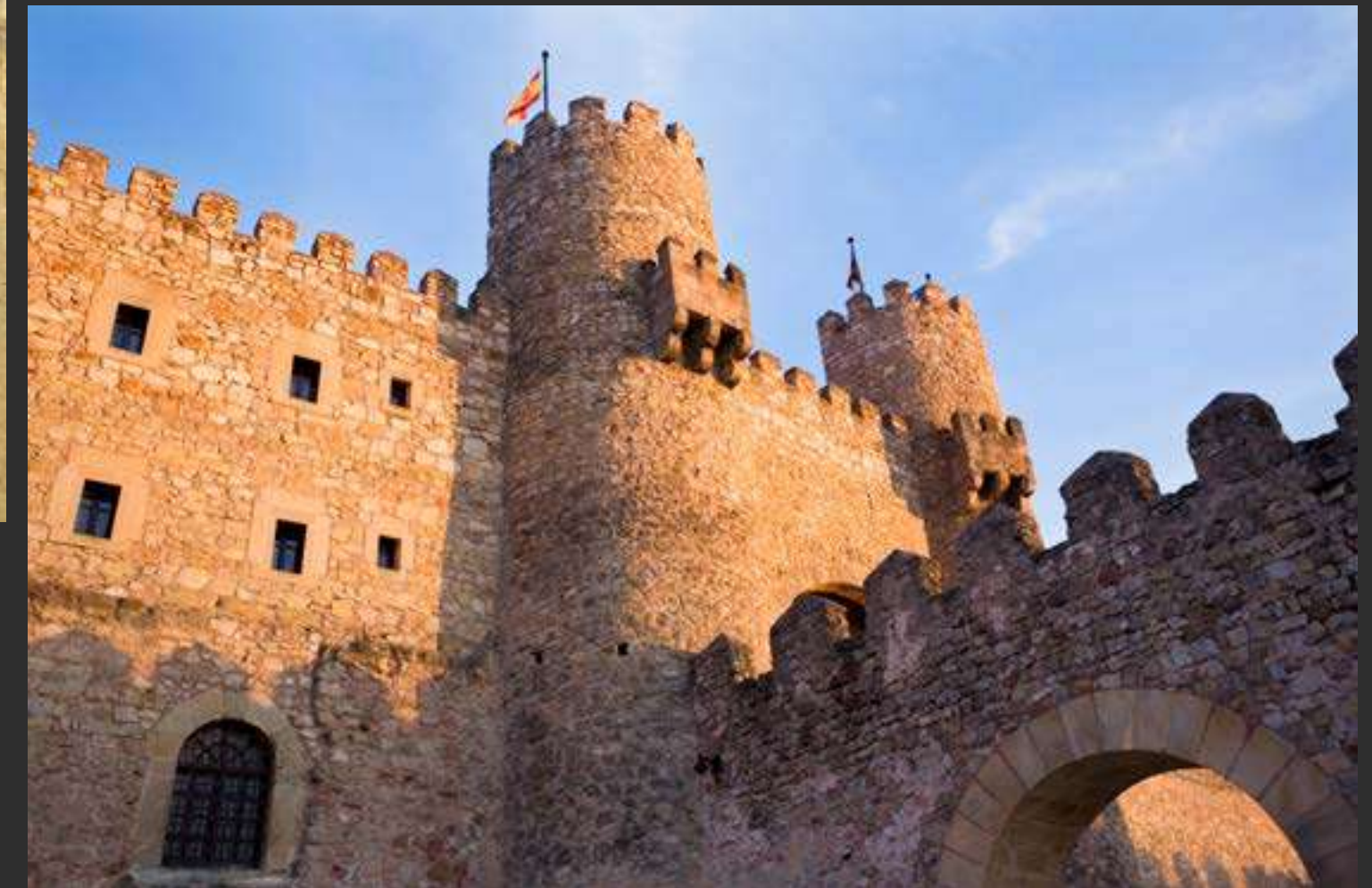
→ Parador de Sigüenza Parador of Sigüenza