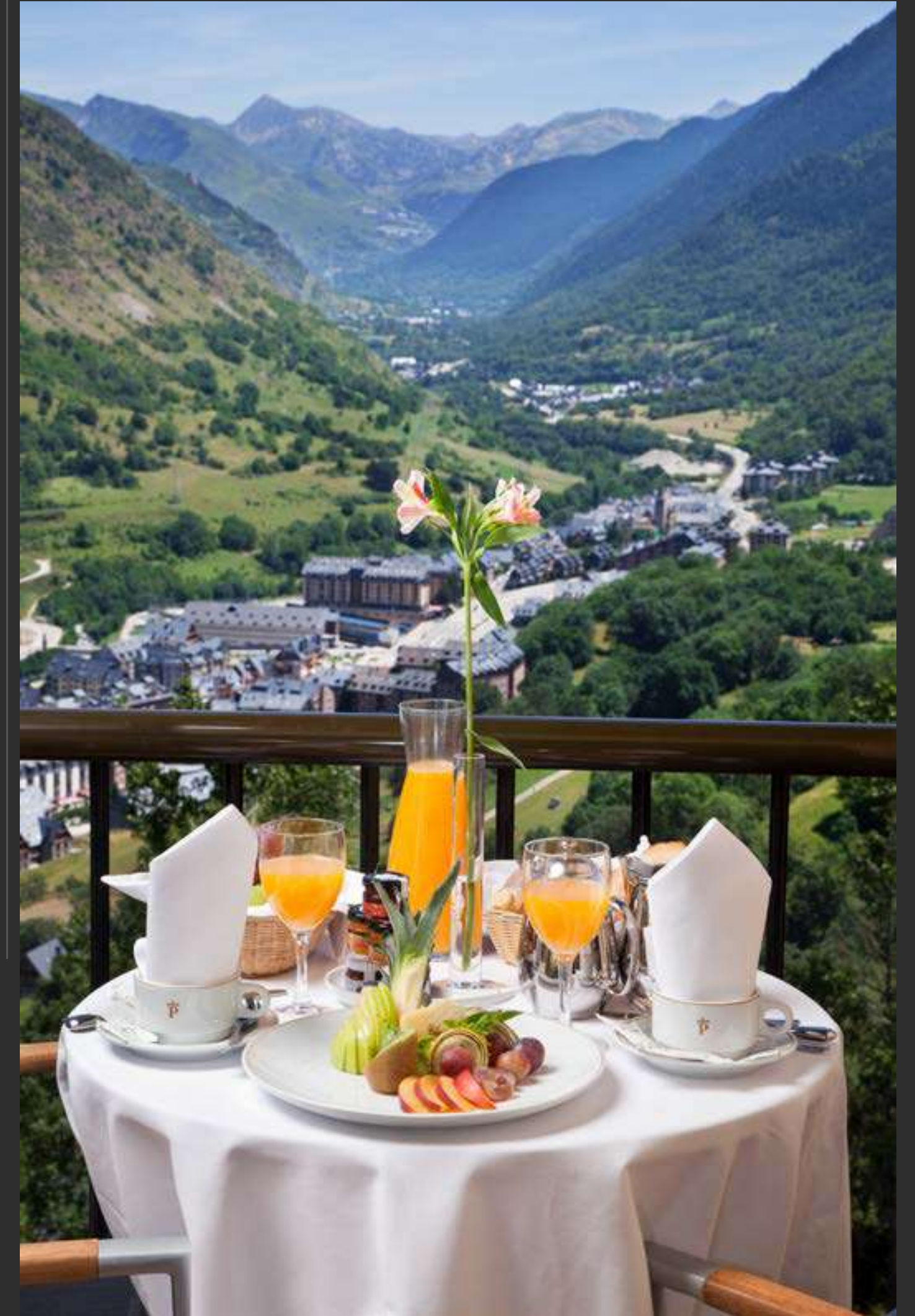
↑ Parador de Vielha Parador of Vielha