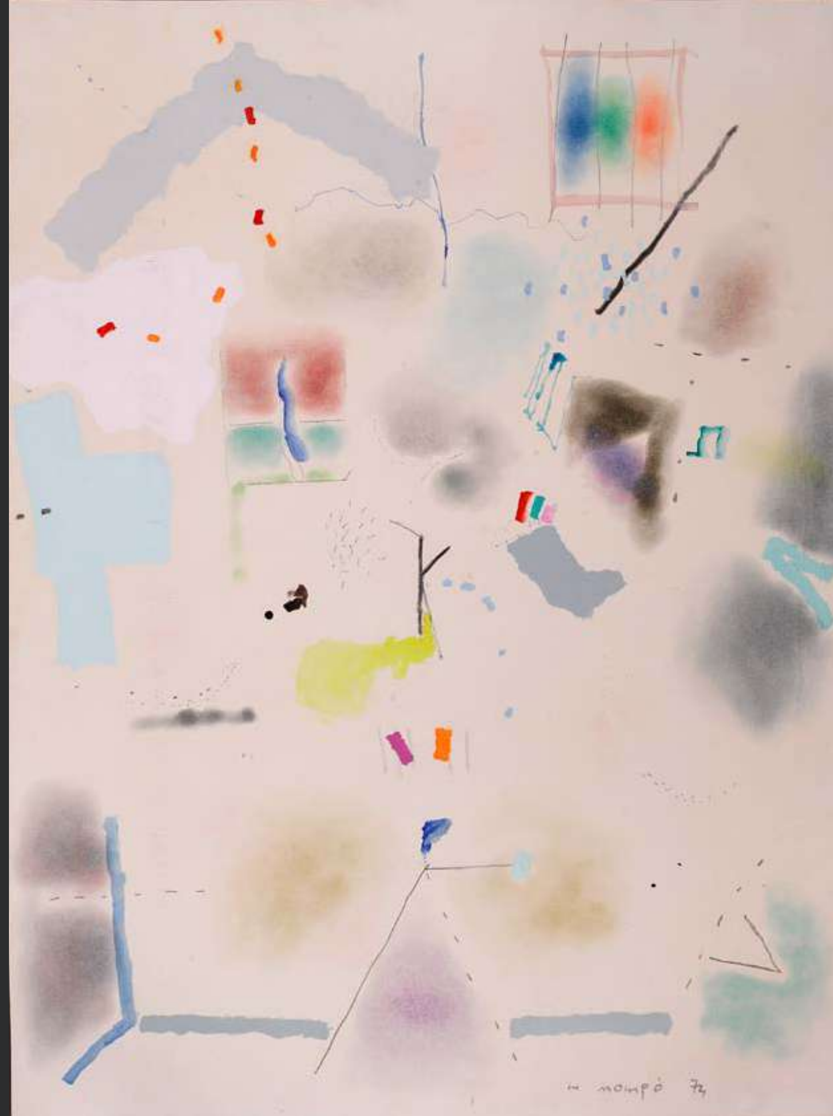
↑ MANUEL HERNANDEZ MOMPÓ Personajes en una calle · 1974 Litografía. Parador de Málaga Gibralfaro

MANUEL HERNANDEZ MOMPÓ Characters on the street · 1974 Lithography. Parador of Málaga Gibralfaro