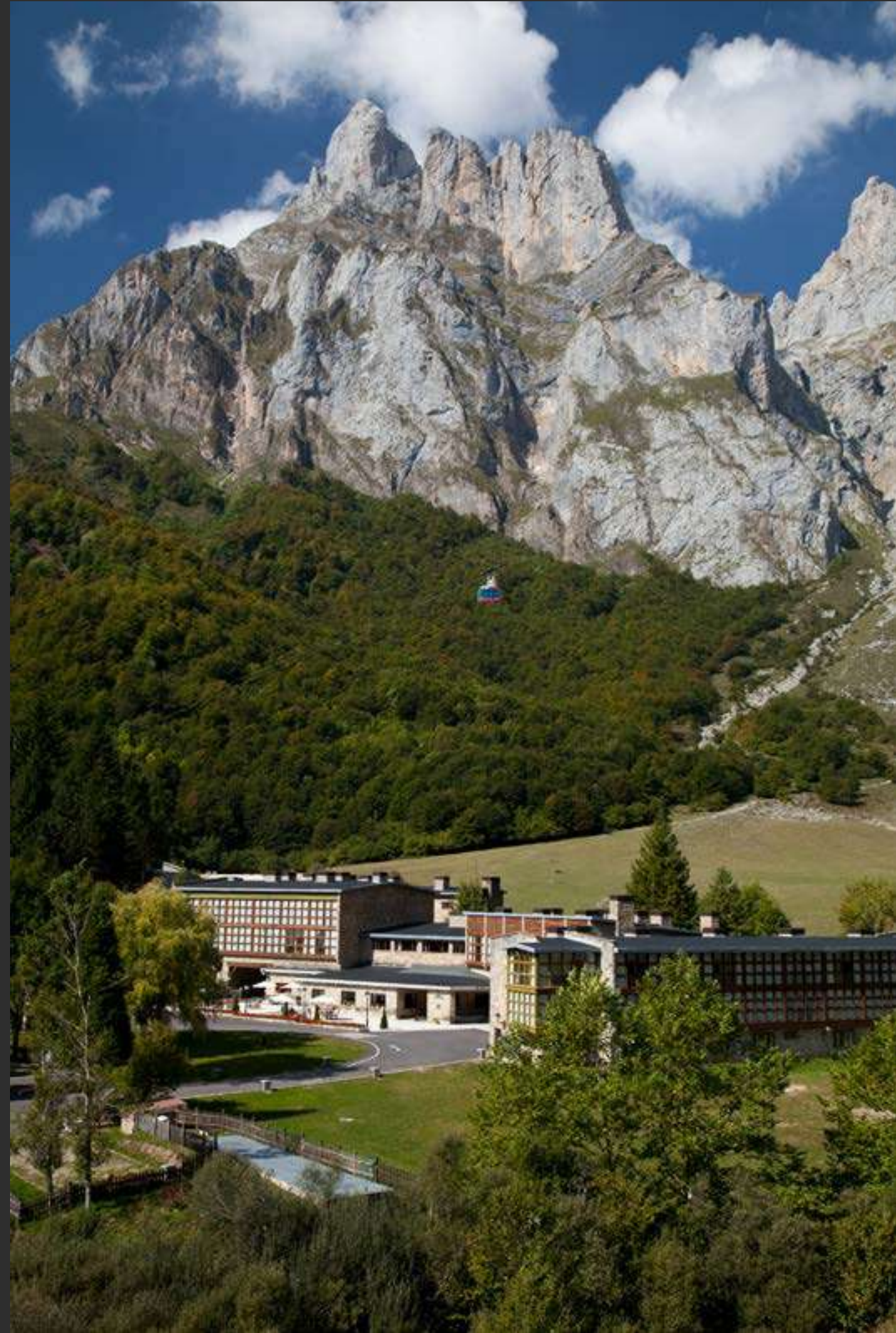
↑ Parador de Fuente Dé Parador of Fuente Dé