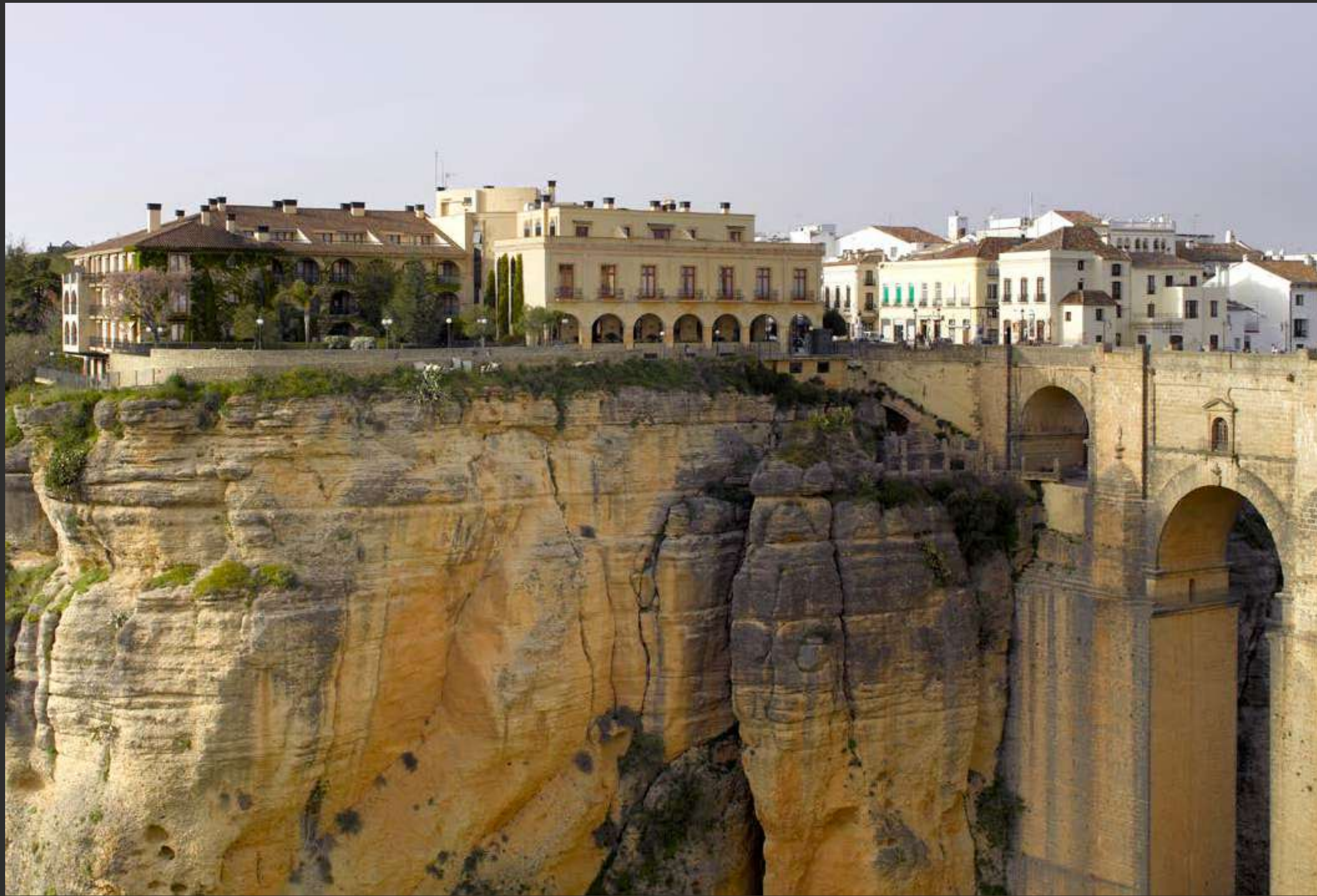
↑ Parador de Ronda Parador of Ronda