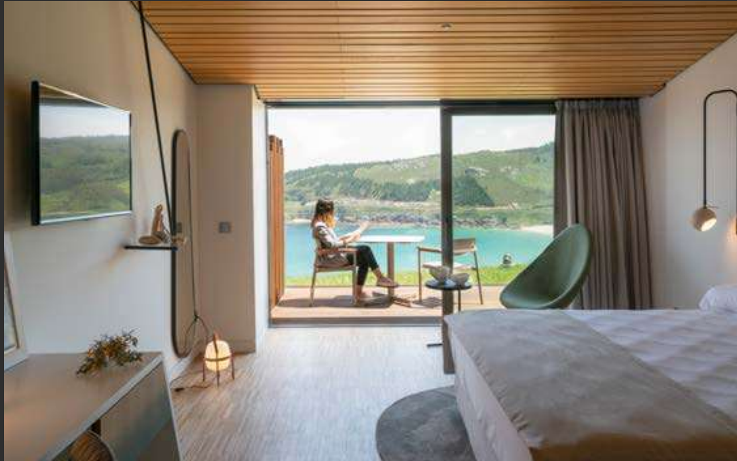
Parador Costa da Morte ↑ Parador Costa da Morte