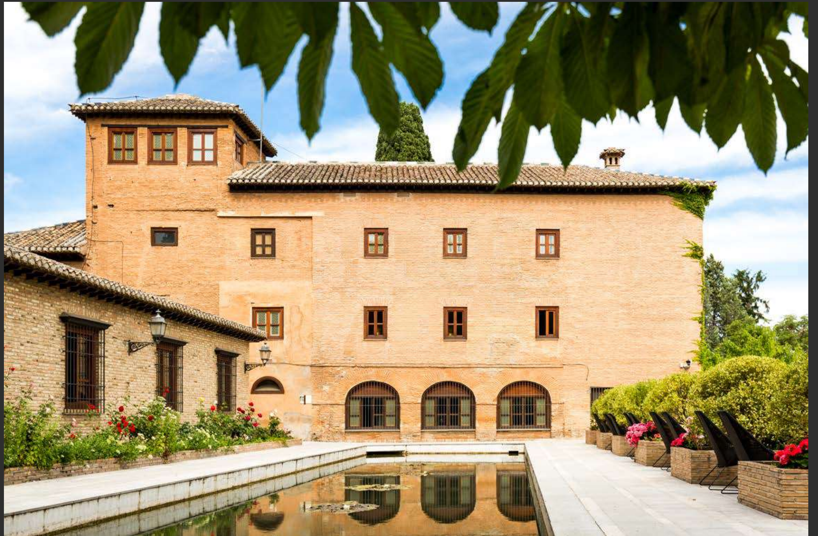
Parador de Granada → Parador of Granada