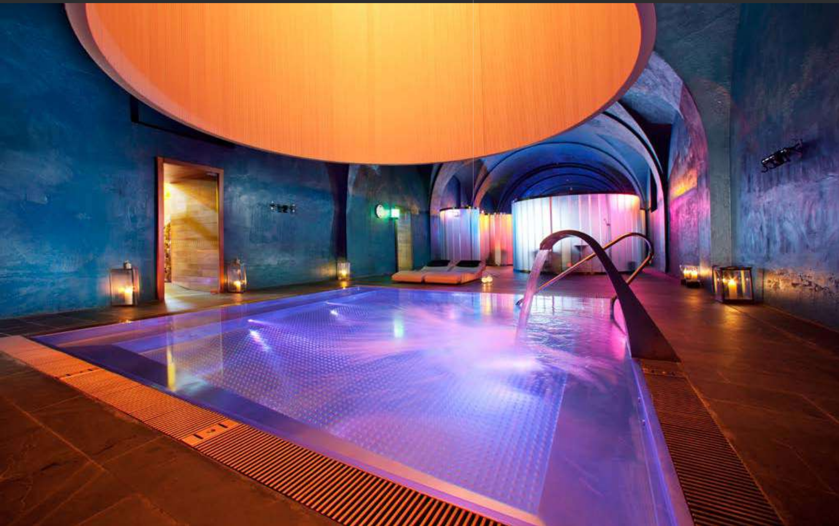
↑ Parador de Alcalá de Henares Parador of Alcalá de Henares