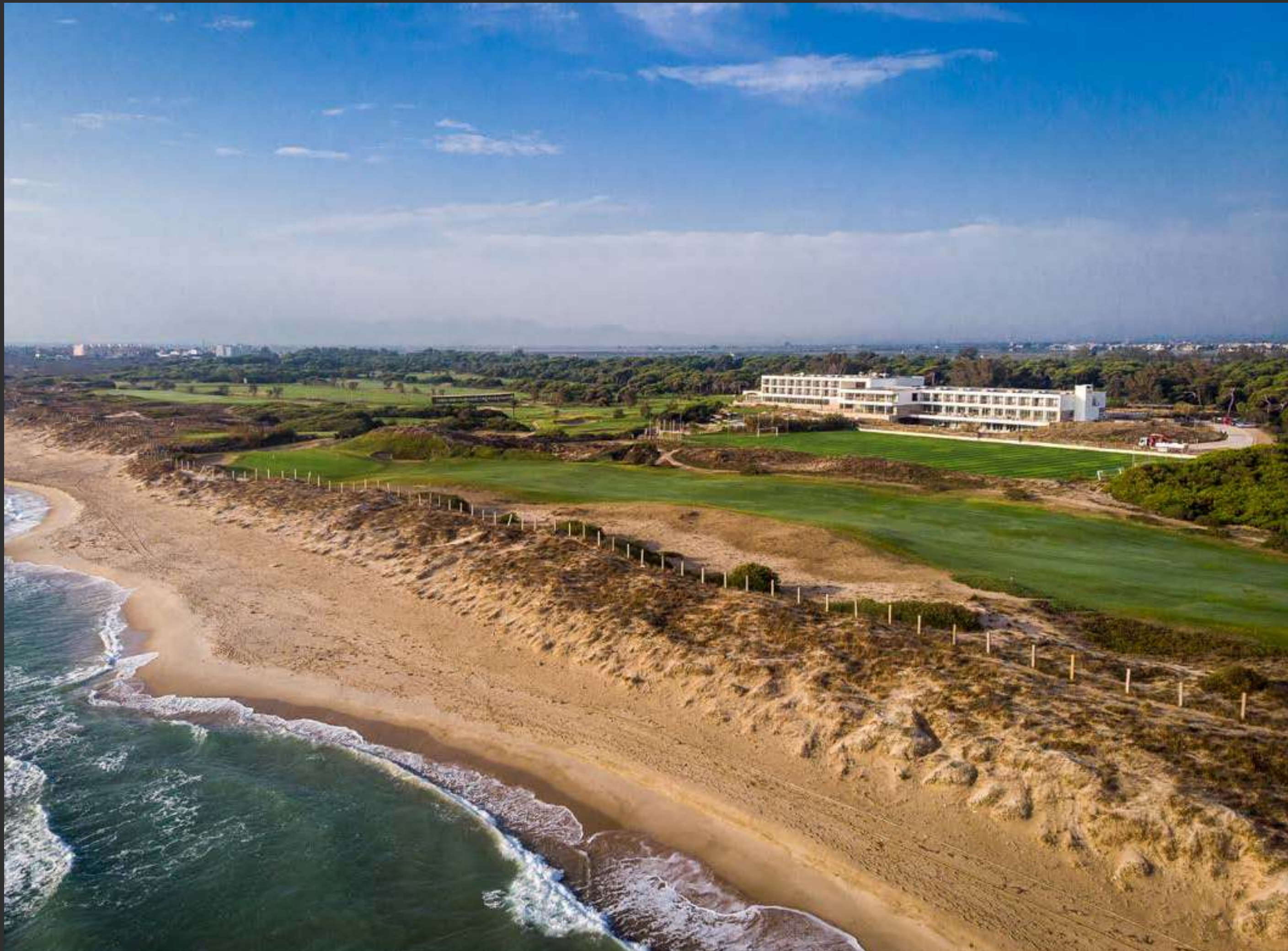
↑ Parador de El Saler Parador of El Saler