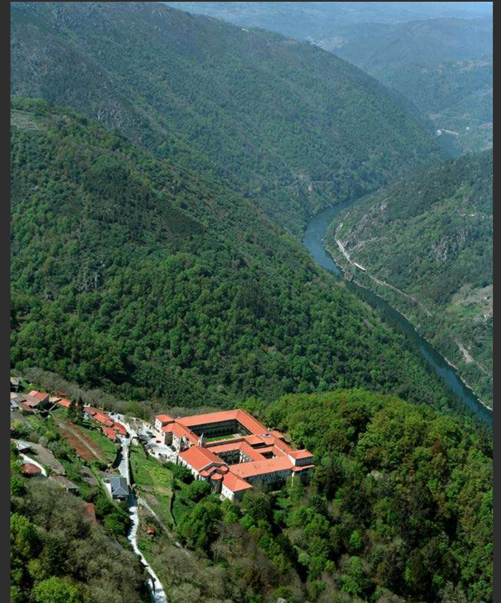
↑ Parador de Santo Estevo Parador of Santo Estevo