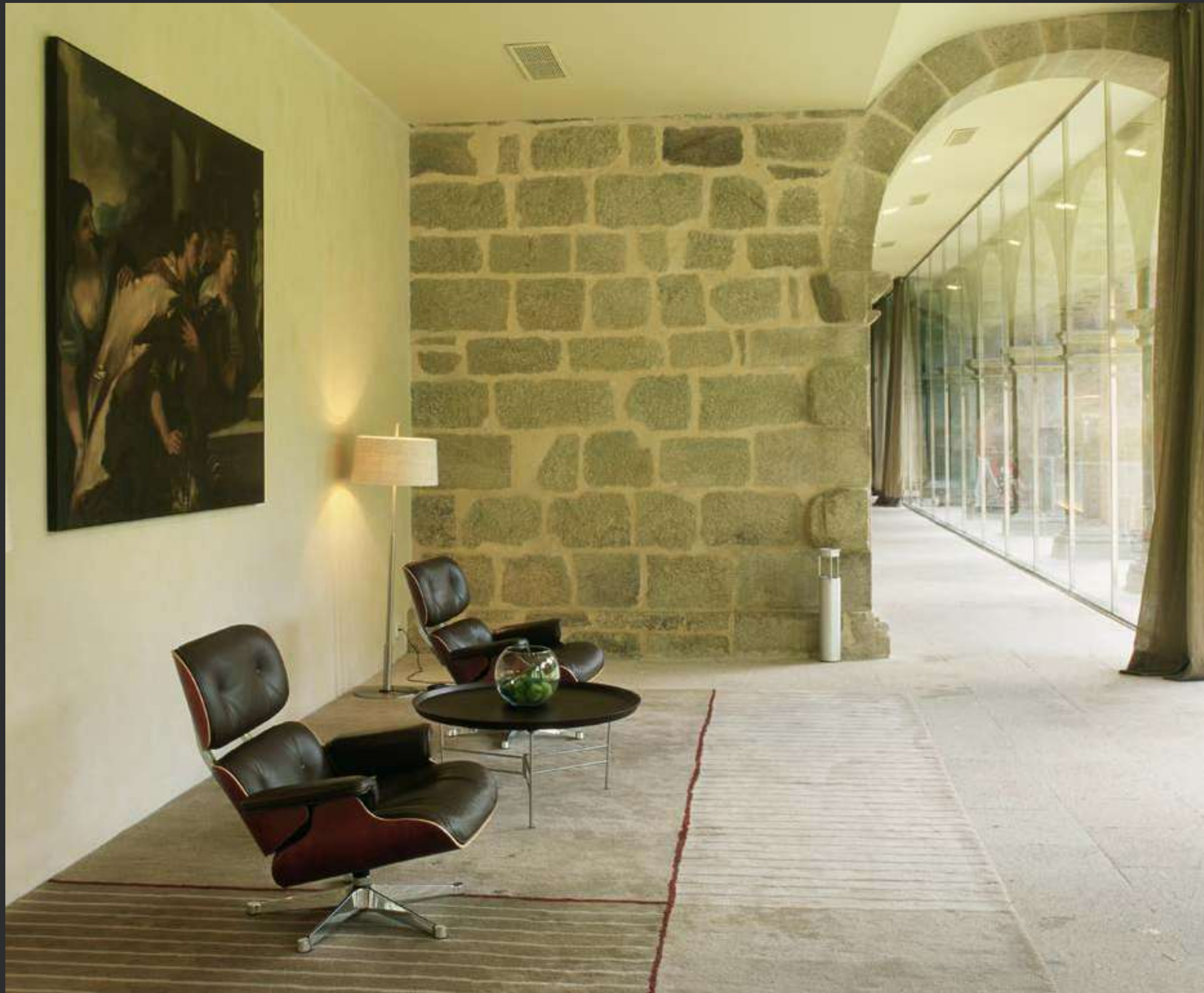
↑ Parador de Santo Estevo Parador of Santo Estevo